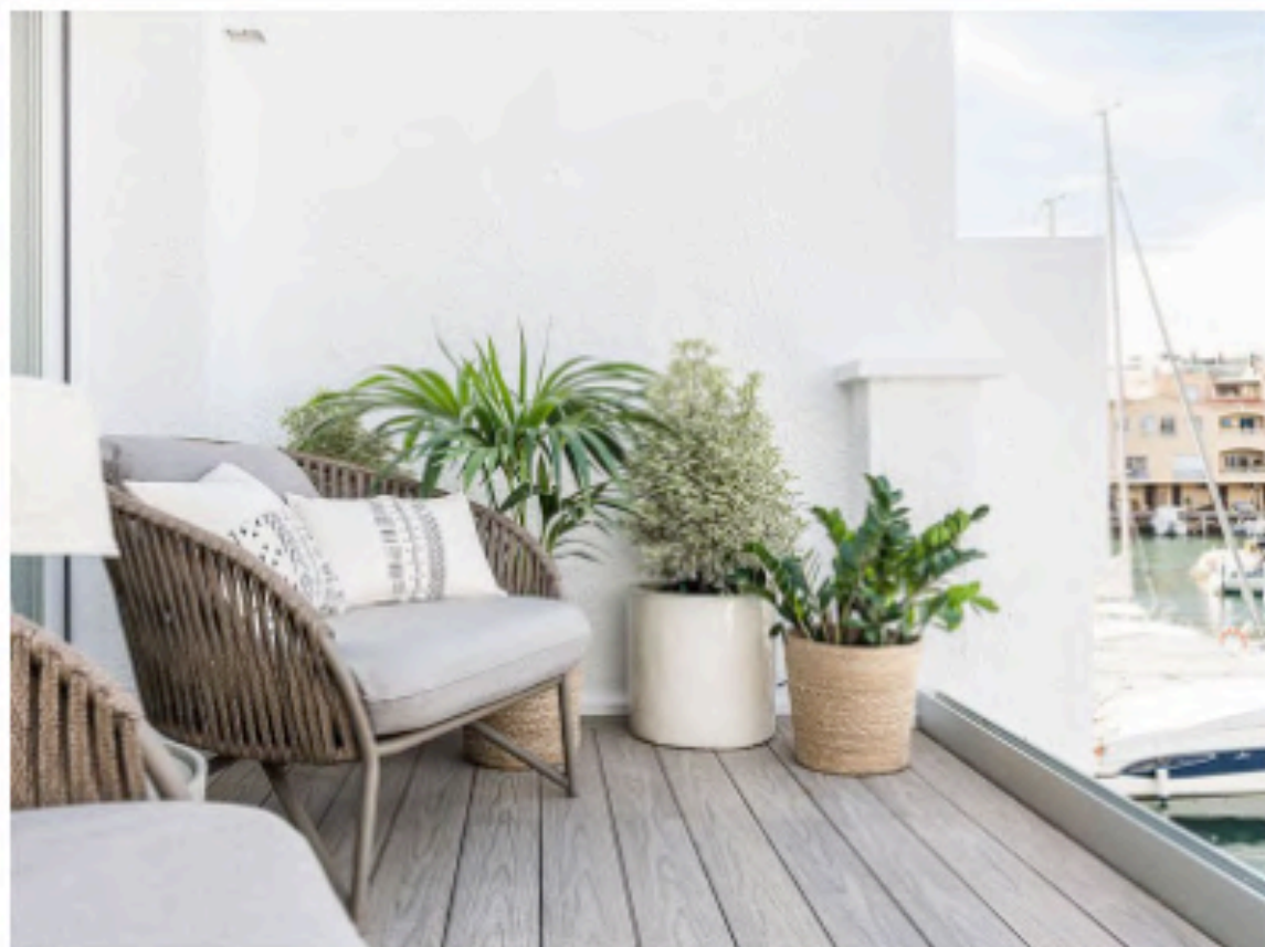
Balcón de estilo natural frente al salón con vistas al mar y el puerto

La vivienda forma parte de la marina residencial que caracteriza esta urbanización construida cerca de la playa y alrededor de una extensa red de canales artificiales inspirados en la ciudad de Venecia. Y aunque es un destino vacacional, el propietario no quería que las estancias desprendieran una estética muy estival porque va a disfrutar la casa de enero a diciembre.