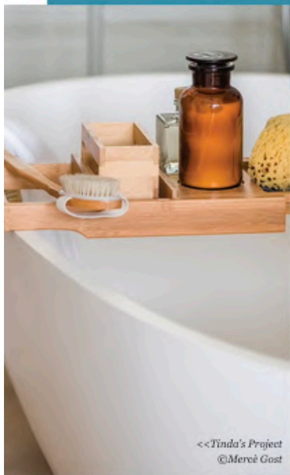
<<Tinda's Project