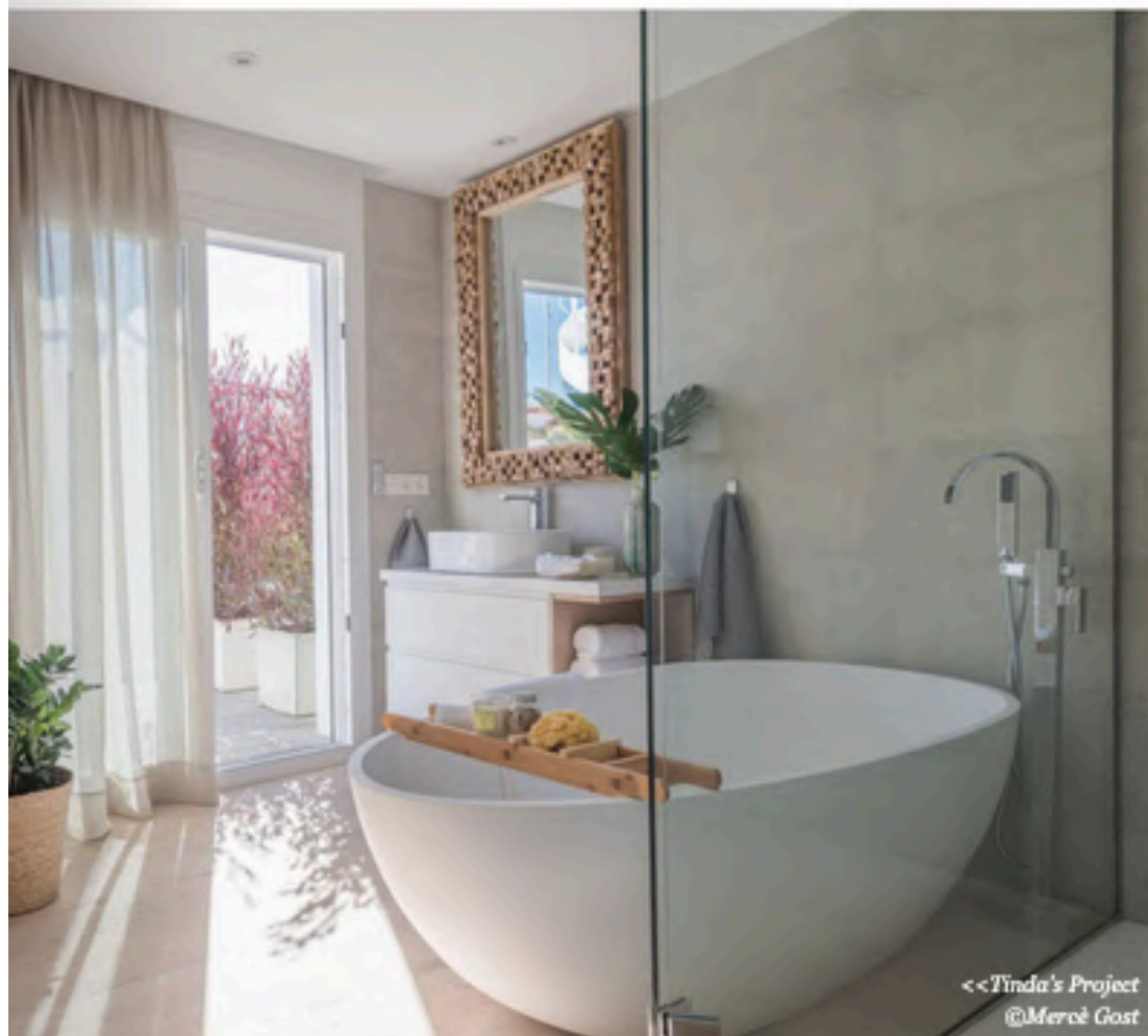
<<Tinda's Project @Mercè Gast

Al hilo del debate sobre si decantarse por bañeras exentas o encastradas, y más allá de las tendencias, en Kaldewei consideran que es una decisión que depende más del diseño y las medidas del espacio, también del precio, "pero creo que lo que más influye es la expectativa que tenga el usuario de disfrutar de un espacio especial de relajación. De su rincón particular" , dice el country manager de la marca.