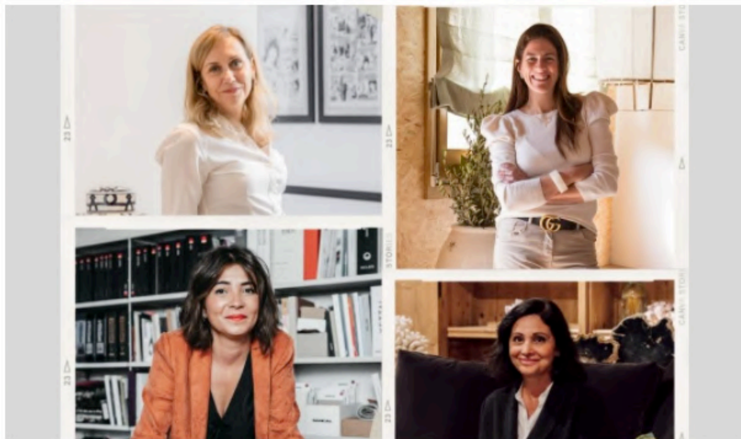
4 mujeres interioristas que ya están triunfando en España