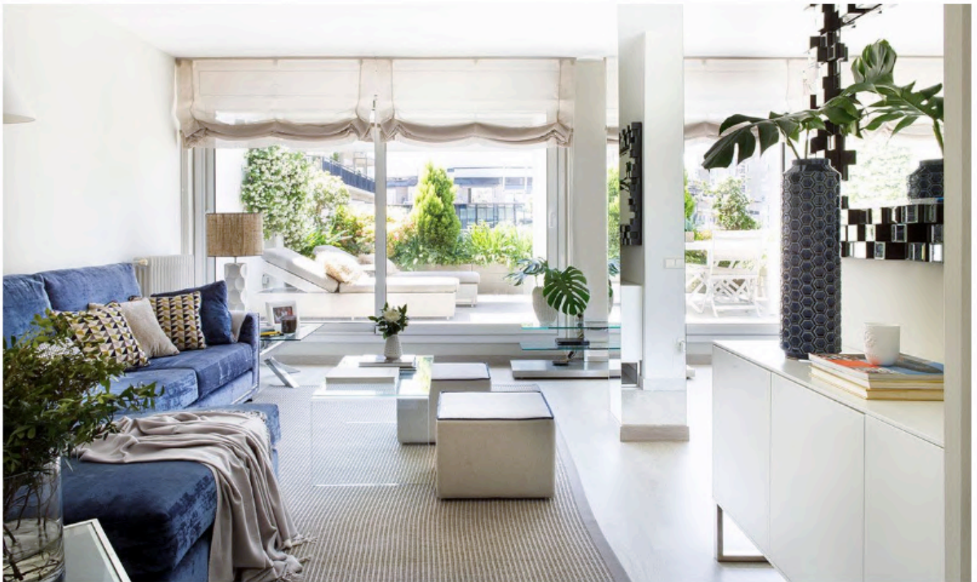
Una reforma a la medida de una nueva vida y con el color azul por bandera