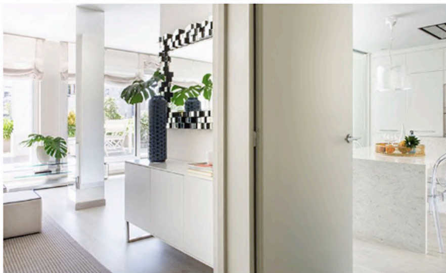
La cocina, además de su conexión abierta al salón-comedor, cuenta con otra práctica puerta junto al recibidor Foto: Jordi Canosa Estilismo: Mar Gausachs

La vivienda, de planta rectangular, cumple la tan recomendable distribución de, a partir de un acceso central, separar las dos áreas principales. En este caso, la zona de noche se encuentra a la derecha del recibidor, coincidiendo con la fachada posterior y, por tanto, la más tranquila, y a la zona de día se accede a la izquierda de la entrada y tiene vistas a la calle.