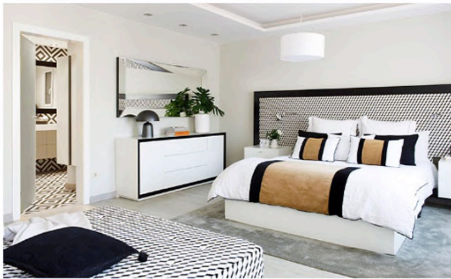
Las formas geométricas y los toques blancos y negros de la suite tienen su continuidad en el baño Estilismo: Mar Gausachs

La vivienda, de planta rectangular, cumple la tan recomendable distribución de, a partir de un acceso central, separar las dos áreas principales. En este caso, la zona de noche se encuentra a la derecha del recibidor, coincidiendo con la fachada posterior y, por tanto, la más tranquila, y a la zona de día se accede a la izquierda de la entrada y tiene vistas a la calle.