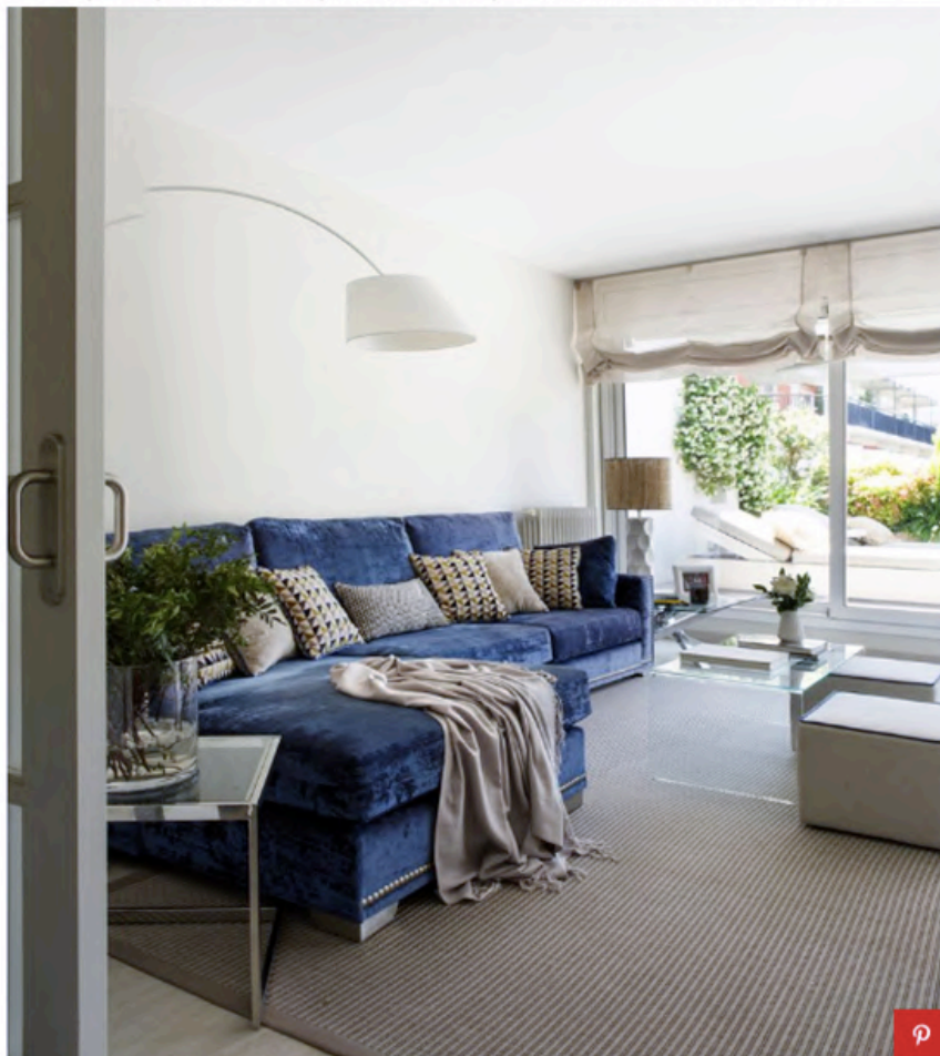
Sofá, puffs y cojines diseñados a medida por Tinda's Project con tejido de Casamance. Mesa auxiliar de cristal con patas en aspas, de La Forma. Lámpara de pie Biosca y Botey. Mesa de centro, de Cattelan Italia.

Los tres ambientes que componen esta zona –salón, comedor y cocina– suman casi 60 metros cuadrados y se han planteado visualmente como un único espacio abierto. Podría decirse que cada ambiente, a su vez, está claramente definido por un elemento. El salón se separa del comedor con un pilar estructural que se ha revestido de espejo para integrar su presencia de una forma más discreta. Por su parte, lo que delimita la cocina es una gran puerta acristalada, una opción muy buena para quien busca separación física pero, a la vez, conexión visual.