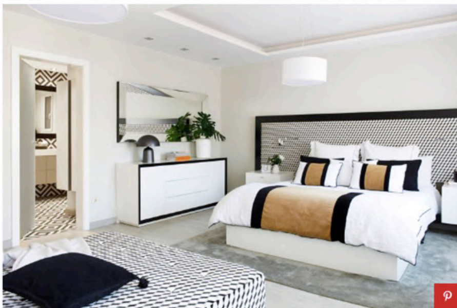
Especo, de Schuller. Lámpara negra y cojines y pies de cama, de Catalina House. Cojín blanco con pespunte negro, de Sacum. Cojín negro, de Gancedo. Textil lino, de Textura. Libros, de Luzio. Jarrón blanco, de Taller de las Indias.