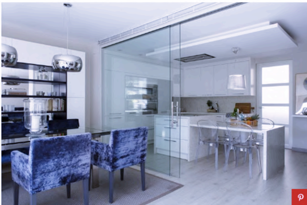
Mesa de comedor, de Cattelan Italia. Sillas diseñadas a medida por Tinda's Project con tejido de Casamance. Alfombra, de Papiol Alfombras. Lámparas de techo, de Schuller.

La cocina, a la que se puede acceder también por una puerta junto al recibidor, se ha distribuido en forma de L con muebles a medida en una gama de blancos, que se combinan perfectamente con el suelo de parquet claro y la encimera de Silestone con acabado marmoleado. El conjunto crea un ambiente muy luminoso potenciado por la luz directa que recibe desde la terraza.