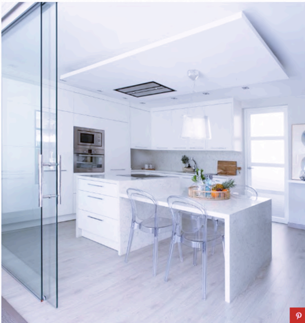
Muebles de cocina lacados diseñados a medida. Encimera, de Silestone. Lámpara techo y sillas, de Kartell. Grifería, de Galindo. Electrodomésticos, de Electrolux. Campana, de Smeg.

La cocina, a la que se puede acceder también por una puerta junto al recibidor, se ha distribuido en forma de L con muebles a medida en una gama de blancos, que se combinan perfectamente con el suelo de parquet claro y la encimera de Silestone con acabado marmoleado. El conjunto crea un ambiente muy luminoso potenciado por la luz directa que recibe desde la terraza.