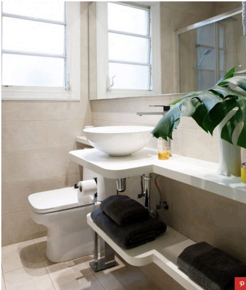
Mobiliario diseñado a medida por Tinda's Project. Sanitarios, de Roca. Grifería, de Galindo. Revestimiento, de Azul Acocsa. Toallas, de Textura.

A mano derecha del recibidor se accede a un pasillo que conduce a dos dormitorios y un aseo de cortesía. Una vez más, se ha optado por los tonos neutros y elegantes, destacando la textura del revestimiento de la pared, así como la encimera que debió hacerse a medida por las dimensiones del baño. Su diseño continuo se estrecha de lado a lado para ofrecer un punto de apoyo para accesorios decorativos, etc. reservando una parte más ancha para la base del lavabo, una forma que se duplicó en la parte inferior para las toallas.