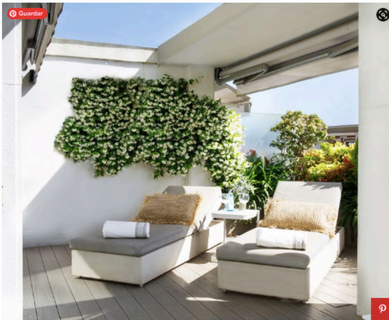
Proyecto de paisajismo de Natural Gardens con jazmín. Terraza con jardín vertical y dos tumbonas macrocarpa y mobiliario de Green Design.

A mano derecha del recibidor se accede a un pasillo que conduce a dos dormitorios y un aseo de cortesía. Una vez más, se ha optado por los tonos neutros y elegantes, destacando la textura del revestimiento de la pared, así como la encimera que debió hacerse a medida por las dimensiones del baño. Su diseño continuo se estrecha de lado a lado para ofrecer un punto de apoyo para accesorios decorativos, etc. reservando una parte más ancha para la base del lavabo, una forma que se duplicó en la parte inferior para las toallas.