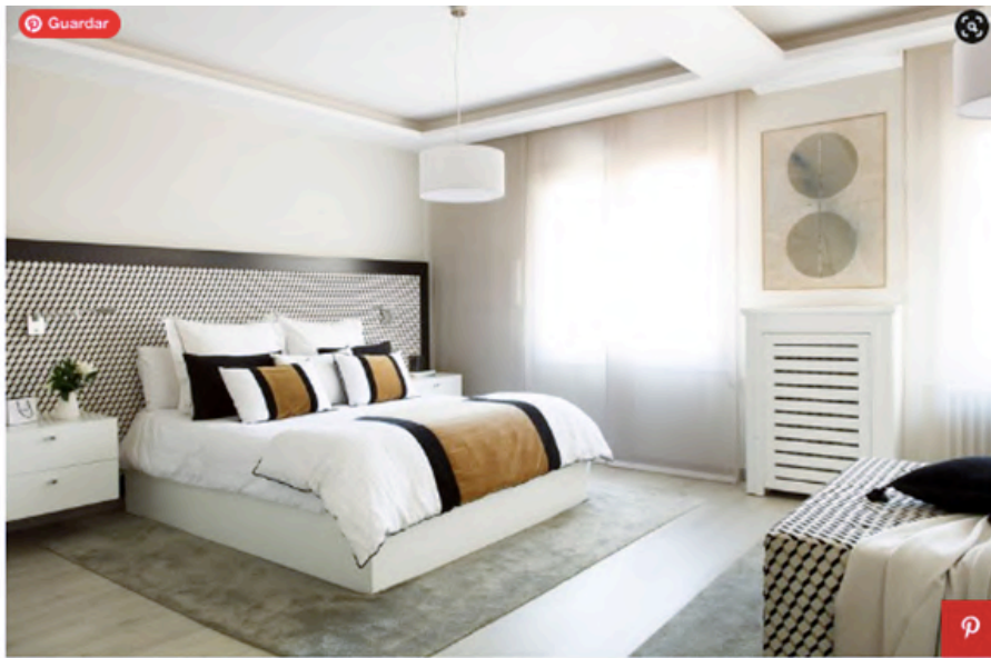
Cabecero, puff y cortinas diseñados a medida por Tinda's Project con tejido de Casamance. Alfombra, de Papiol Alfombras. Cuadro, de Lu-Ink.