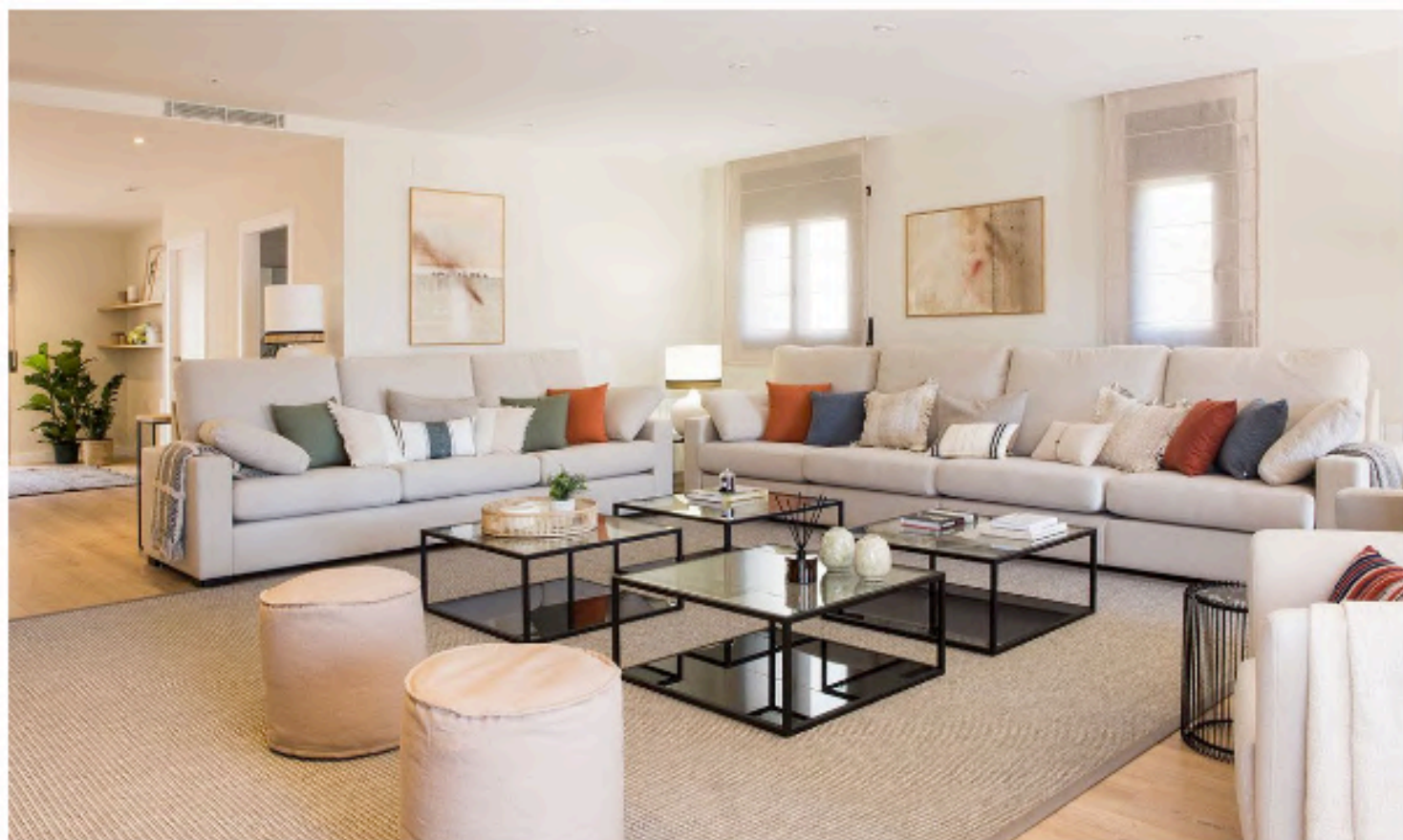
Salón de una casa de 200 m2 decorada con colores neutros, maderas y con un jardín para toda la familia

Estilismo: Mar Gausachs