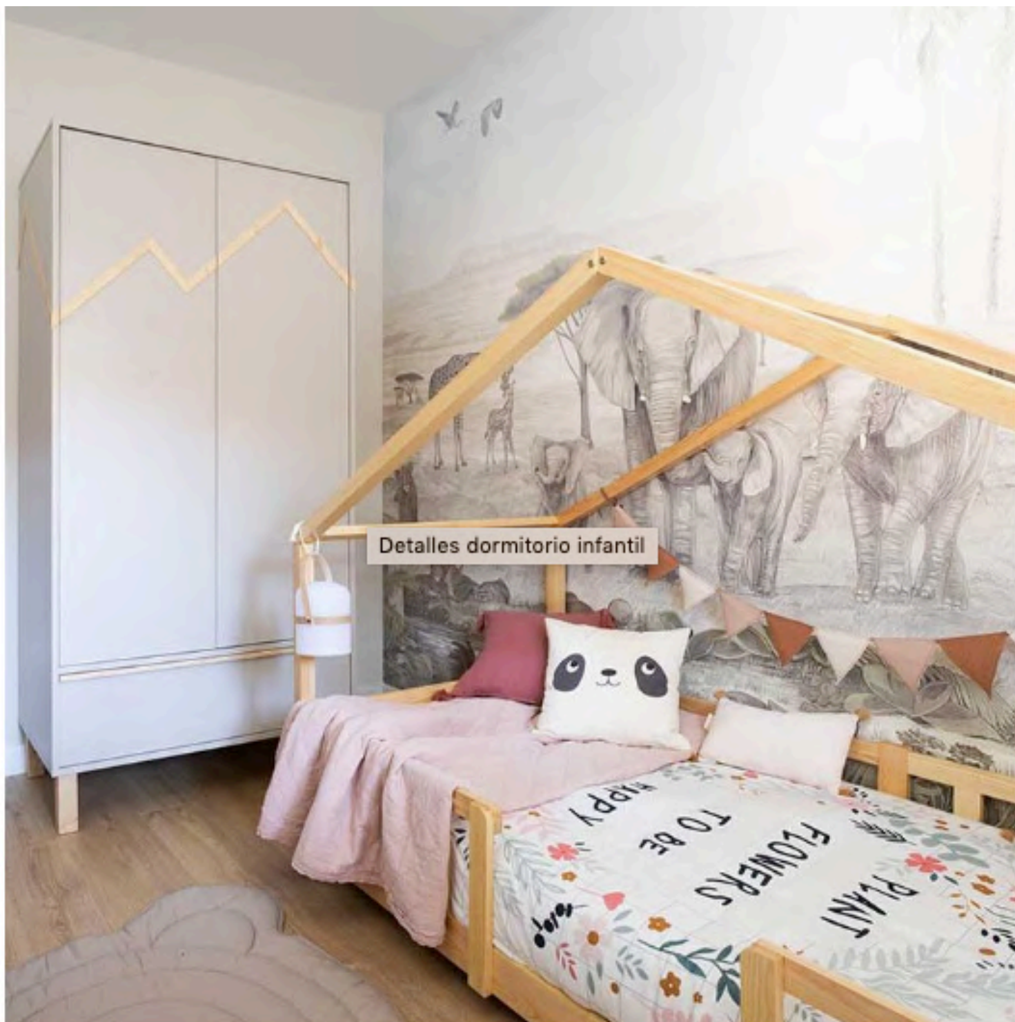
Estilismo: Mar Gausachs