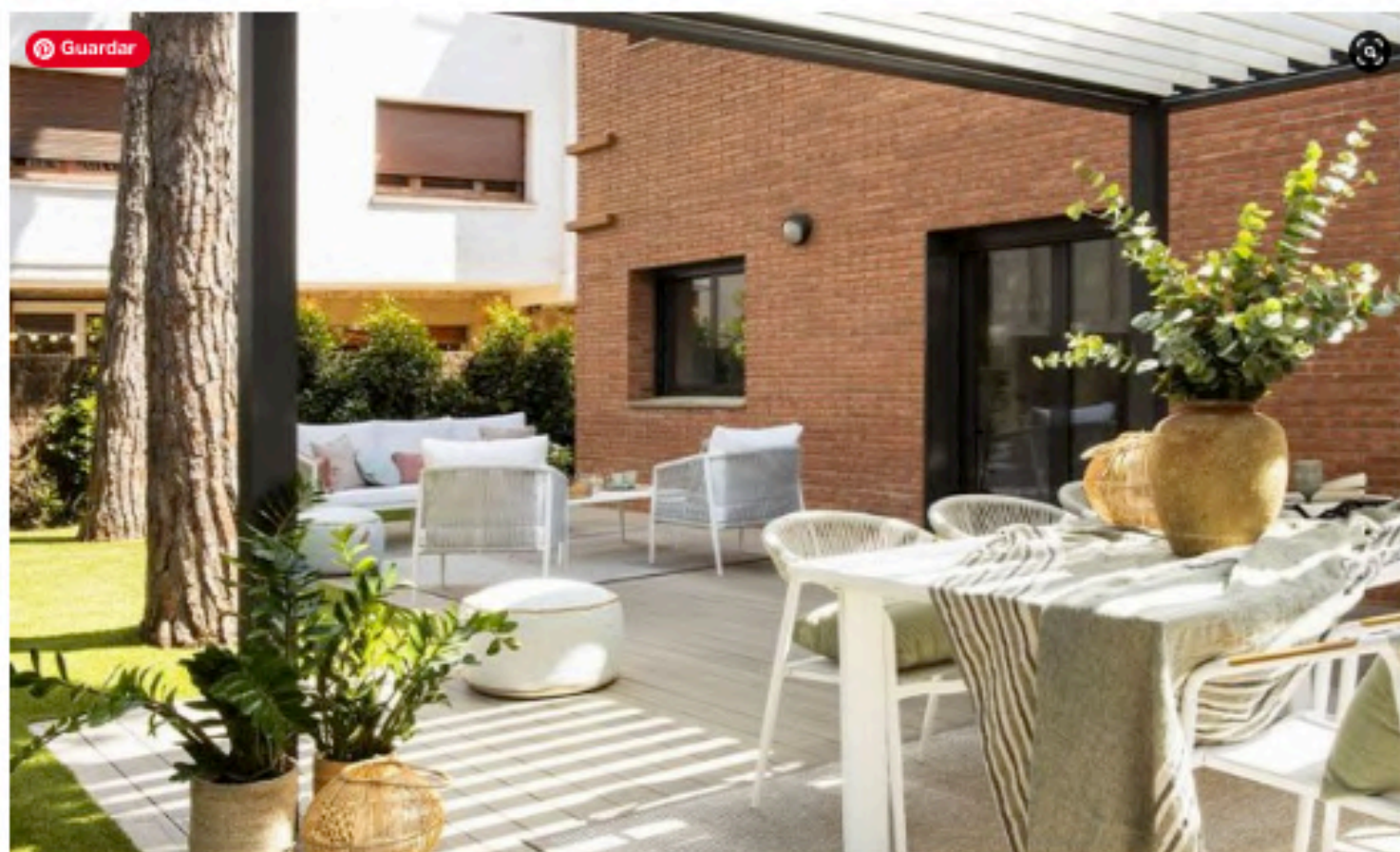
Estilismo: Mar Gausachs